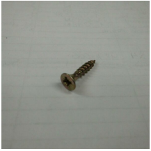
VIS AGGLO TF PZ ZN BICHRO 4X20