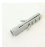
CHEVILLE NYLON RAWL F6