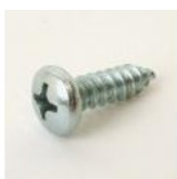
VIS À TOLE TBC 4,8X16 ZINGUEE