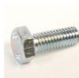
VIS METAUX TH 6X16 ZINGUEE