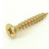
VIS AGGLO 4X25 TF