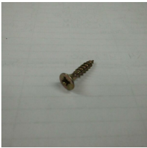
VIS AGGLO TF PZ ZN BICHRO 4X20