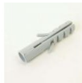
CHEVILLE NYLON RAWL F6