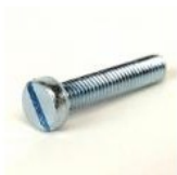
VIS METAUX TC 5X25 FENDUE ZINGUEE