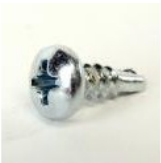
VIS AUTOFOREUSE TC- CRUCIFORME 3,5 X 9,5 INOX