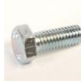
VIS METAUX TH 6X16 ZINGUEE