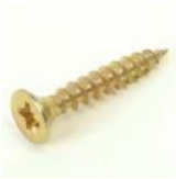
VIS AGGLO 4X25 TF