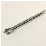
GOUPILLE FENDUE DE 5 X 45