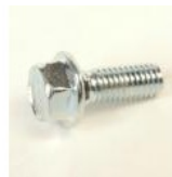
VIS ACIER ZN TH CC M5X14