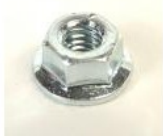
ECROU HU4 INOX