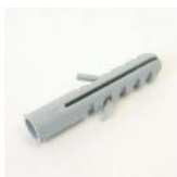
CHEVILLE NYLON RAWL F8