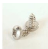
VIS À TOLE TBL I 3 5X6.4 TCB INOX