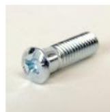
VIS TF 5X18 POUR GENOILLERE ET POIGNEE MANIVELLE