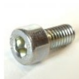
VIS À TETE CYL.DIN 912 M5 X 10 MM