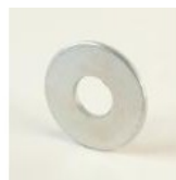
RONDELLE PLATE LU 6 ZINGUEE