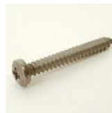
VIS À TOLE TC POZI 7981 INOX 4.2X32