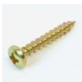
VIS BOIS TETE CYLINDR.BOMBEE ZINGUE CK + 6 X 40