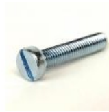
VIS METAUX TC 5X25 FENDUE ZINGUEE