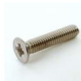
VIS METAUX TF POZI 965 4X20 ZI