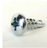
VIS AUTOFOREUSE TC- CRUCIFORME 3,5 X 9,5 INOX