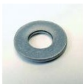
RONDELLE PLATE INOX M4 X 10