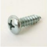
VIS À TOLE TBC 4,8X16 ZINGUEE