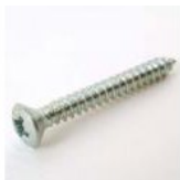
VIS À TOLE TFB 3,9X32 ZINGUEE