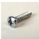
VIS TOLE TC PZ ST 3,5X16