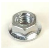
ECROU FREINE M5