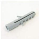
CHEVILLE NYLON RAWL F8