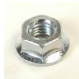
ECROU FREINE M5