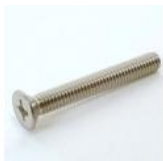
VIS TF INOX M4 X 30