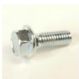
VIS ACIER ZN TH CC M5X14