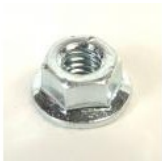
ECROU HU4 INOX