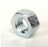
ECROU HU6 ZINGUE L