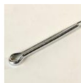
GOUPILLE FENDUE DE 5 X 45