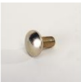
VIS SPECIALE AVEC CARRE SOUS LA TETE M 6 X 12 ZING